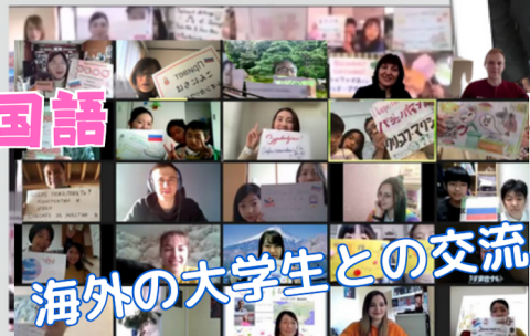
海外の大学生との交流