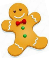
部活前にみんなでクリスマスクッキーを作り、飾り付けしました！